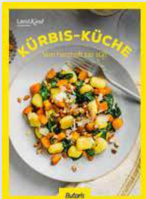
Kunde: Markenartikelhersteller Food